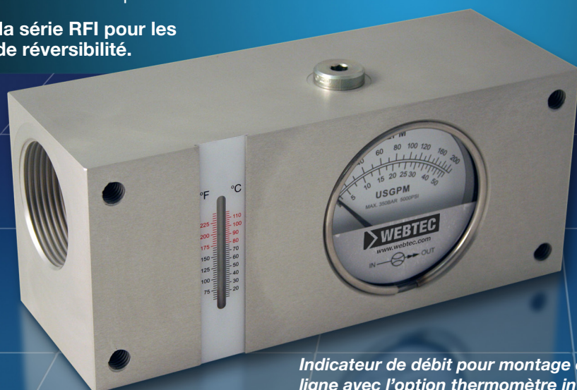
Indicateur de débit pour montage en ligne avec l'option thermomètre intégrée.

Voir la série RFI pour les cas de réversibilité.